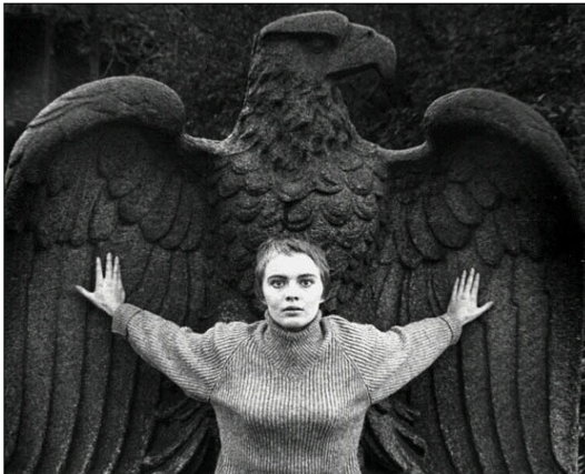
Jean Sieberg, actrice américaine. Héroïne avec Jean-Paul Belmondo du film de Jean-Luc Godard « A BOUT DE SOUFFLE »

En réalité, la mode foncièrement blasphématoire des cheveux courts est un signe à peine subliminal, invitant la femme à se délier des termes bibliques de vie. Termes bibliques déclarés vieux jeu, car opposés à une philosophie de consommation directe. Vieux jeu, car déclarés comme privilégiant le meilleur à long terme, ce qui paraît insupportable aux âmes d'humains pressés en tout ce que nous sommes devenus. La jouissance paisible et juste des choses dans un long terme est devenue un choix de vie insupportable pour nos générations inquiètes, fébriles, issues de deux guerres mondiales et d'une troisième en discontinu, ici et là sur la planète, depuis.